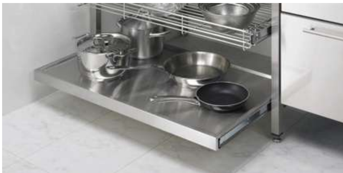
引き出しはこのようになります。

※ 2022年12月 現在のものです。予告無く変更することがございます。あらかじめご了承ください。