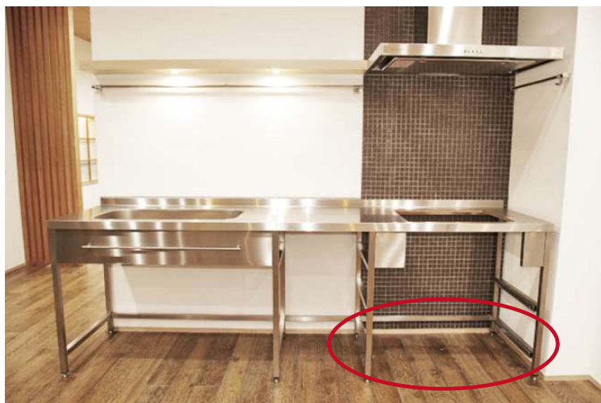
赤丸の位置に取付けます。