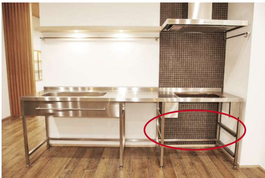
赤丸の位置に取付けます。