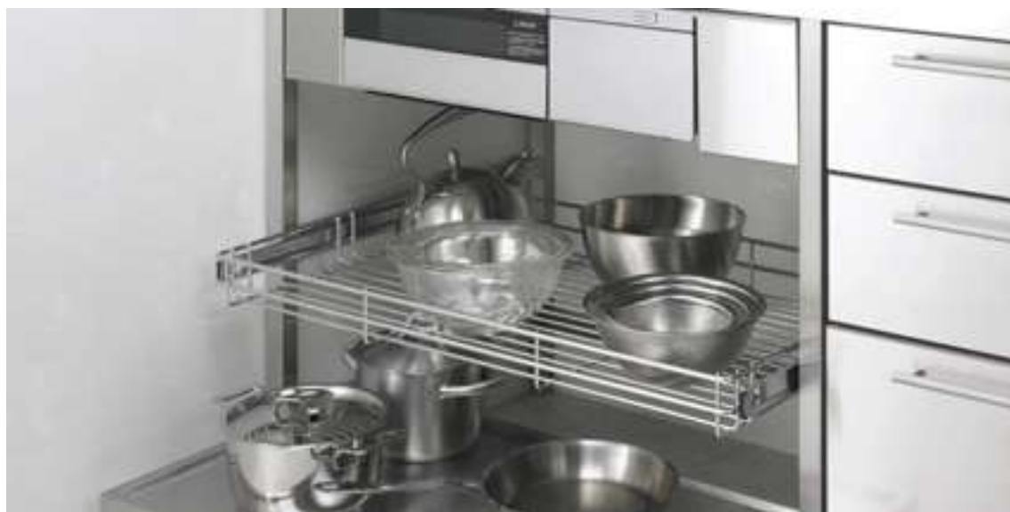
引き出しはこのようになります。

※ 2022年12月 現在のものです。予告無く変更することがございます。あらかじめご了承ください。