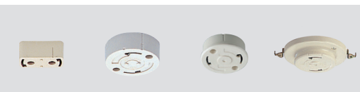
角形引掛シーリング 丸形引掛シーリング ツバ付丸形引掛シーリング *ツバ付埋込ローゼット耳つき *ツバ付埋込ローゼット耳つきには、TYPE-BALL はお取付けできません。