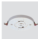
埋込ローゼット耳つき

※こちらの形状のローゼットは、天井からの出が 22mm 以下のため、TYPE-A, TYPE-B, TYPE-BALL すべてお取付けができません。あらかじめご了承ください。