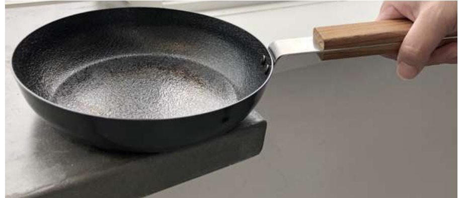
熱したフライパン