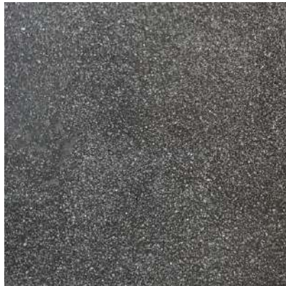
1日放置した後拭き取り 目視でもわからないくらい綺麗に拭きとれました