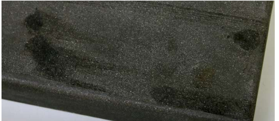
1分放置した後の様子 表面のツヤが消え、質感に変化が現れました。