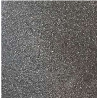
1日放置した後拭き取り 目視でもわからないくらい綺麗に拭きとれました