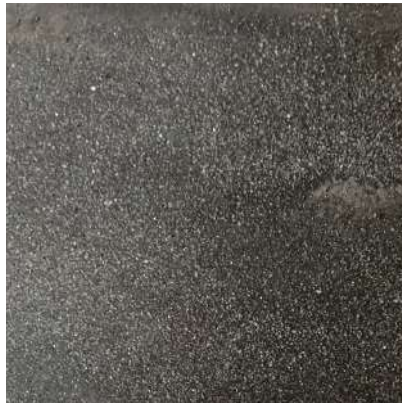
1日放置した後拭き取り 目視でもわからないくらい綺麗に拭きとれました